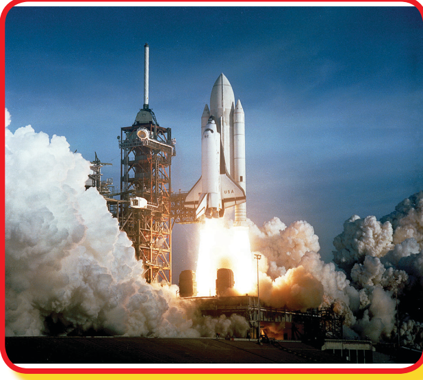
اكتشاف وغزو الفضاء. ■