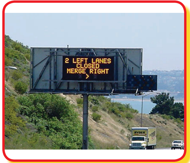
التحكم بالمرور. ■