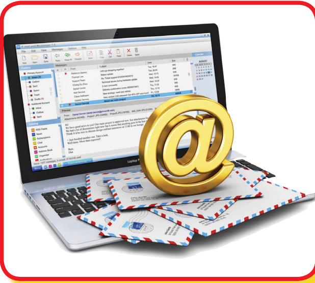
إرسال الإيميلات. ■