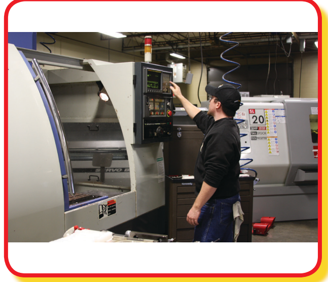
تشغيل المصانع. ■