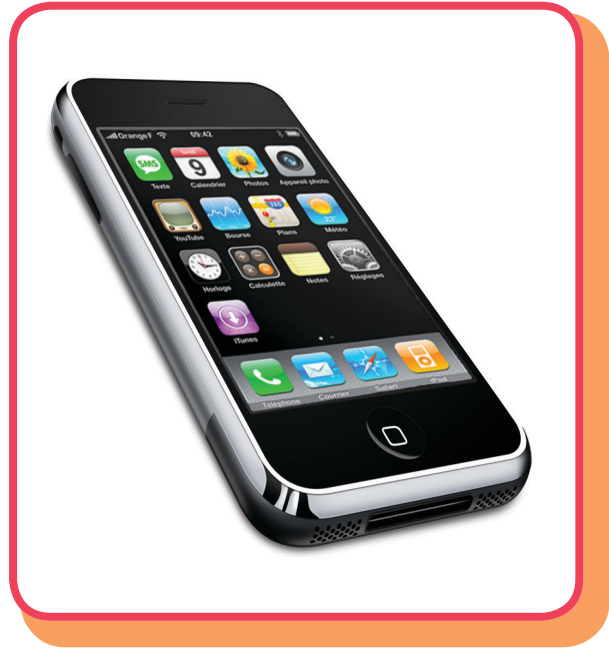
هاتف نقال (موبايل)